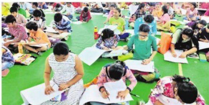
పోటీల్లో పాల్గొన్న విద్యార్థులు