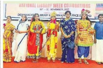
ప్యాన్సీ డ్రెస్ లో విద్యార్థినులు