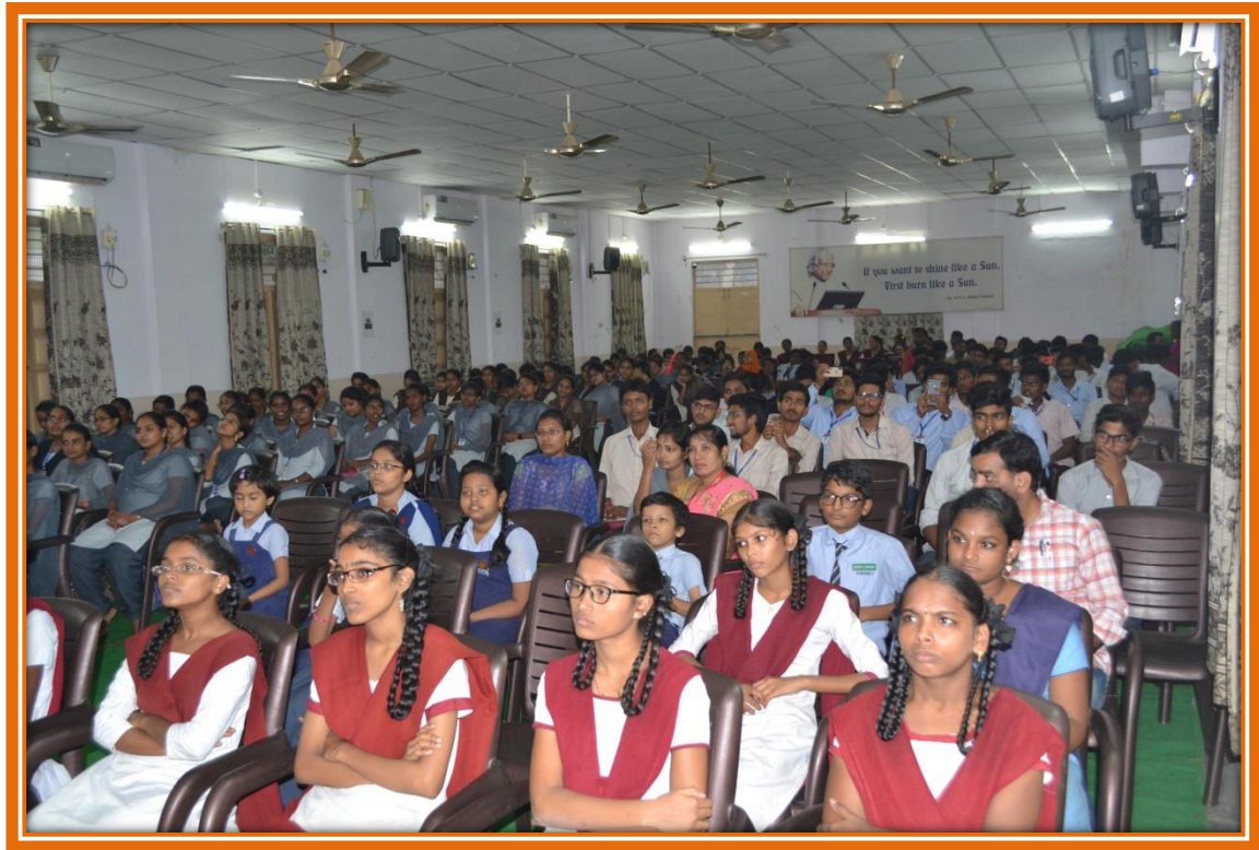
Students at the Programme