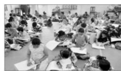
లక్ష్యాలు పోటీల్లో పాల్గొన్న విద్యార్థులు