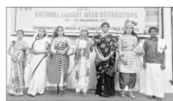
వివిధ వర్గాలలో పాల్గొన్న అధ్యాపకులు