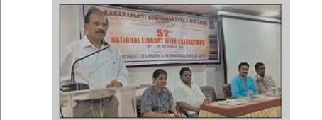
గ్రంథాలయాల పాత్ర అమామం