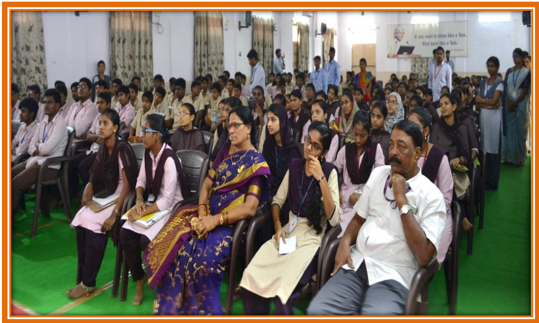
Staff & students at the Programme