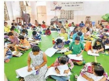
చిత్రలేఖన పోటీల్లో విద్యార్థులు